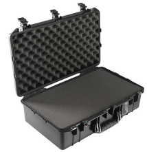
1555WF With Foam